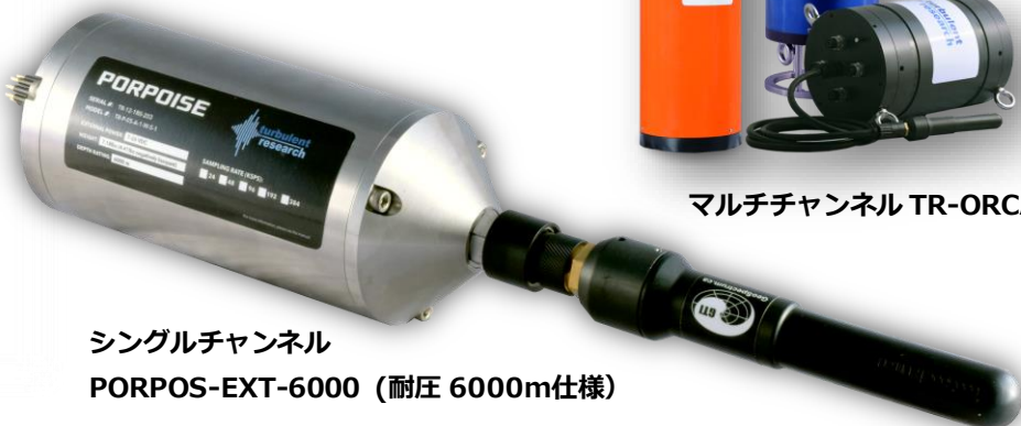
シングルチャンネル PORPOSE-EXT-6000 (耐圧 6000m仕様)