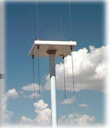
Model : FA-1248B アドコック式シングルチャンネルアンテナ