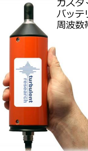
シングルチャンネル PORPOSE (耐圧500m)

水中音響を手軽にレコード可能。 マルチ ハイドロフォンにより広帯域に対応。 カスタマイズで 3,000m、6,000m 仕様も可能。 バッテリーは乾電池対応 (アルカリ or リチウム) 周波数帯域でハイドロフォン選択可能