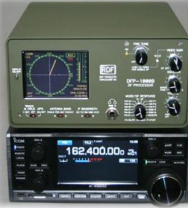
Model : DFR-8600B 方位プロセッサ/ディスプレイ/レシーバー

アンテナは頑丈で耐候性に優れたユニットで移動局・固定局のアプリケーション用に特別設計されておりマスト等への装着が可能。安価なループ式アンテナより優れた感度と能力を有します。