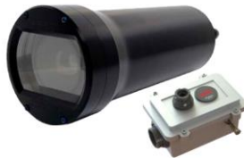
Rayfin Mk2 Coastal 500m