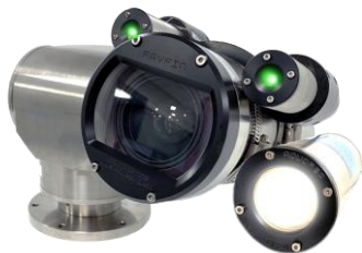
Rayfin Mk2 Benthic 6,000m